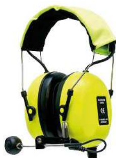
CASQUE ANTI-BRUIT INDUSTRIEL