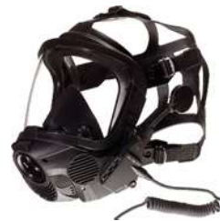
CÂBLE CONNEXION AUDIO