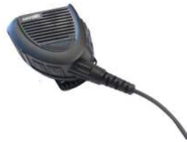
MICRO HAUT-PARLEUR AMPLIFIÉ ET DÉPORTÉ