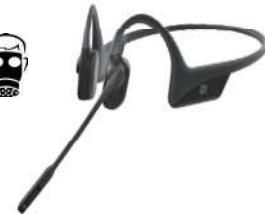
CASQUE BLUETOOTH ULTRA LEGER