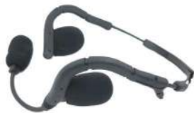
CASQUE AUDIO LEGERS 2 ÉCOUTEURS